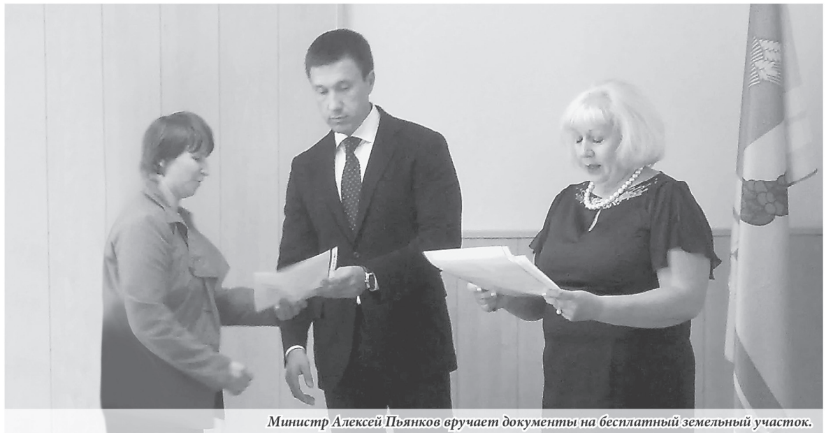
Министр Алексей Пьянков вручает документы на бесплатный земельный участок.

– МУГИСО максимально оперативно отреагировало на сложившуюся экономическую ситуацию, запустив ряд антикризисных мер. Так, в числе стабилизирующих мероприятий ведомством утвержден план по обеспечению устойчивого развития и повышения эффективности деятельности предприятий госсектора Свердловской области, а также предприятий агропромышленного комплекса области.