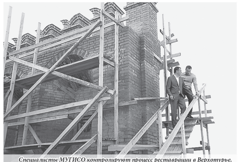
Специалисты МУГИСО контролируют процесс реставрации в Верхотурье.