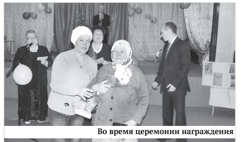
Во время церемонии награждения