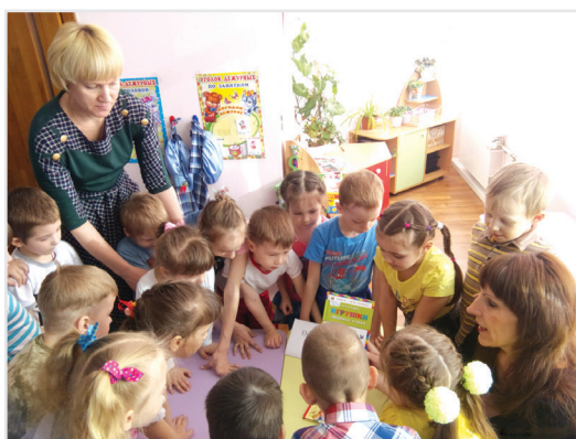
В весёлой компании путешествовать интересно!

20 марта в Екатеринбурге в рамках Года литературы и Всемирного дня поэзии прошёл поэтический марафон «Энергия слова», в котором принял участие и министр культуры Свердловской области Павел Креков. Уральские поэты читали свои стихи вслух пассажирам трамвайного маршрута №18 и проводили для них литературные викторины. В качестве призов пассажиры получили сборники стихов.