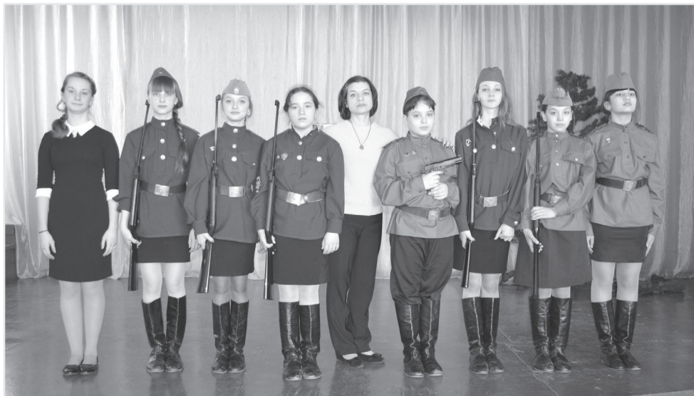
Театральный коллектив из школы №6

яркие костюмы, отлично подобранная музыка, прекрасные декорации, а главное, талант юных артистов – всё