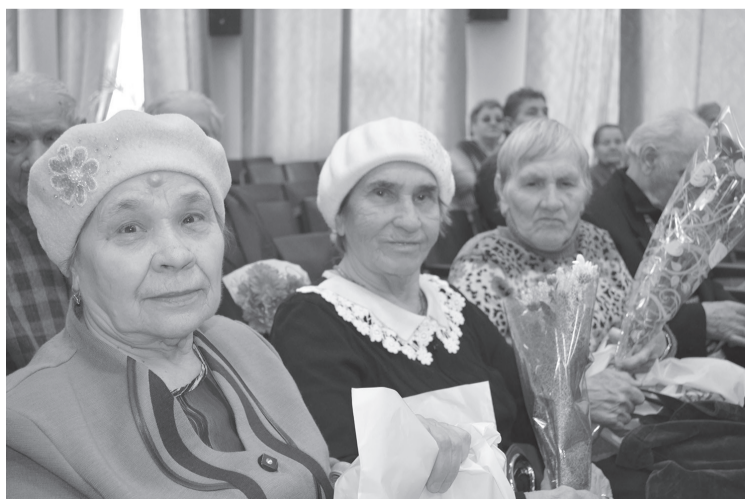
Эти труженицы тыла получили юбилейные медали