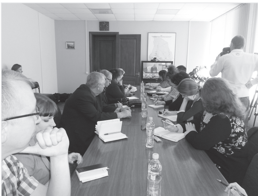
Представители Северного управленческого округа на видеоконференции

Говоря о капитальном ремонте многоквартирных домов, министр отметил, что 75% населения области оплачивают взносы. Областная программа капитального ремонта уже действует: проведено обследование домов, подлежащих капитальному ремонту в первую очередь, определяются подрядчики, которые вскоре приступят к его проведению. Министр подчеркнул: проводится корректировка краткосрочного плана капитального ремонта, так как жители ветхих и аварийных домов будут исключены из этой программы и автоматически перейдут в программу переселения граждан из ветхого и аварийного жилья, поэтому они сейчас не будут платить за капитальный ремонт. По его словам, в этих домах будет проводиться только выборочный ремонт, а со временем жильцов переселят в новые дома. Николай Борисович подвёл первые итоги: в области построено по программе переселения граждан из аварийного жилья 220 многоквартирных домов, в которые переехали более 20 тысяч новосёлов. (При этом