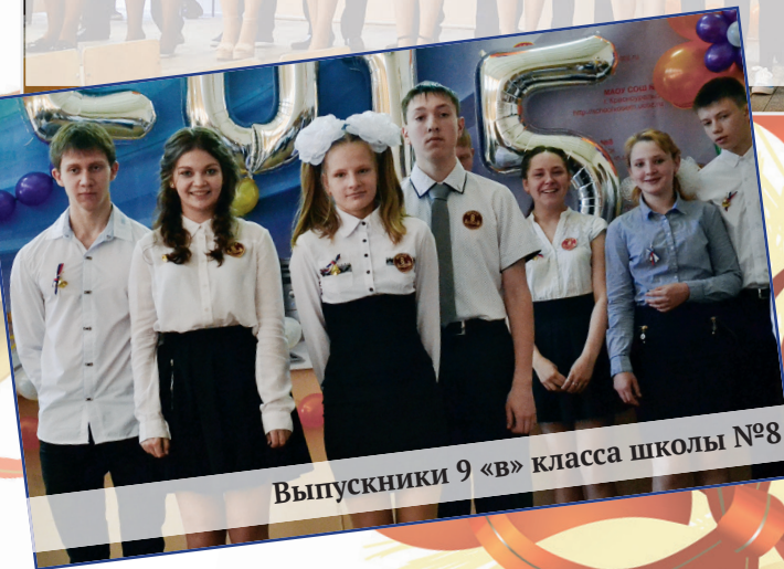
Выпускники 9 «в» класса школы №8

одиннадцати лет вкладывали в них не только знания, но и частичку своего сердца. Расставание с выпускниками для них всегда волнительно, но они уверены, что воспитанники преодолют и этот сложный жизненный этап, сдадут от-