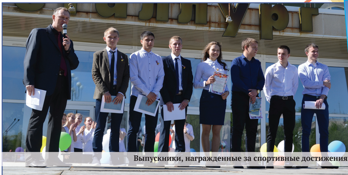
Выпускники, награжденные за спортивные достижения

– Я очень люблю детей, мечтаю поступить в педагогический вуз и получить достойную профессию. Пока еще мне не верится, что школьные годы позади. Возможно, когда я стану студенткой и уеду из города, тогда придет осознание того, что настала взрослая и самостоятельная жизнь.