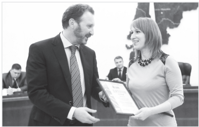
В Екатеринбурге наградили победителей медиа-конкурса «Славим человека труда!»

На конкурс было представлено более 700 работ. Участвовали телекомпании и издания из Екатеринбурга, Тюмени, Челябинска, Магнитогорска, Ханты-Мансийска, Нижнего Тагила, а также телевидение ОАО «Святогор».