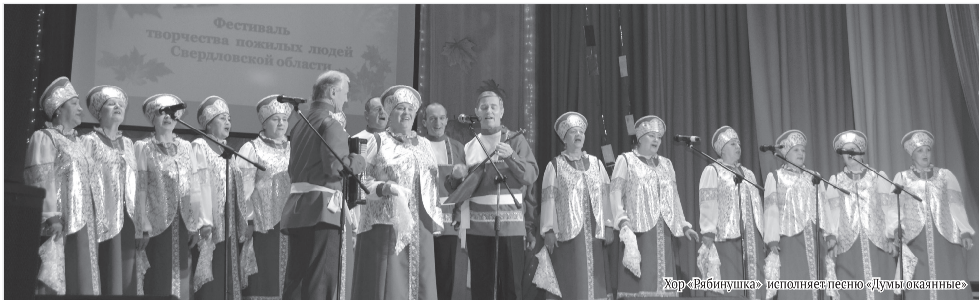
Хор «Рябинушка» исполняет песню «Думы окаянные»