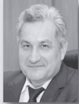
Юрий Биктуганов, министр образования Свердловской области:

«Региональные власти и уральцы высоко ценят политику социального ответственного бизнеса, когда компании и предприятия не только создают рабочие места, обеспечивают выпуск современной продукции и отчисления в бюджеты всех уровней, но и активно участвуют в социальных проектах, программах государственно-частного партнерства, поддерживают образовательные, культурные и спортивные учреждения, помогают муниципальным образованиям, территории которых они расположены».