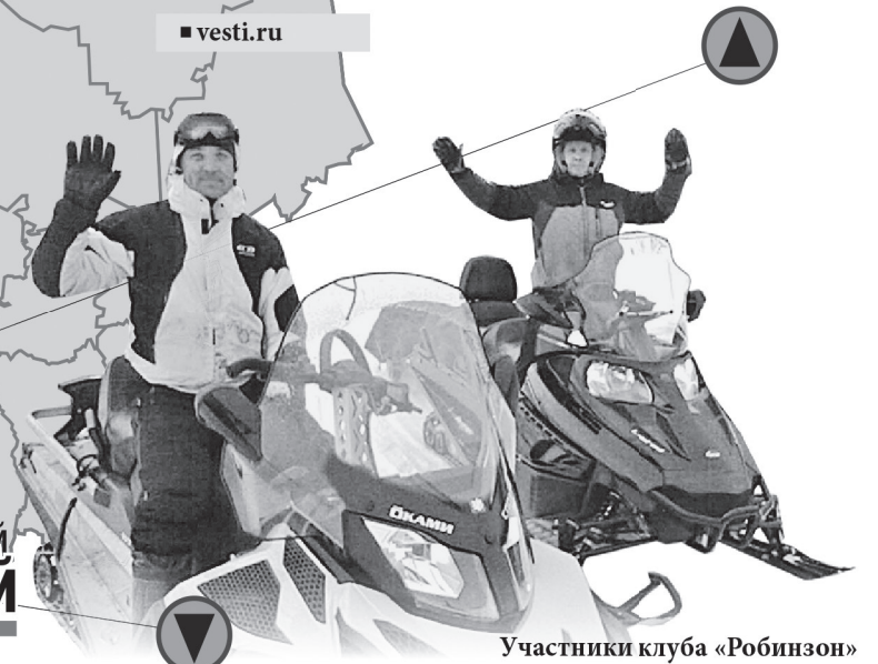
Участники клуба «Робинзон»