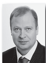
Виктор Шептий, вице-спикер областного парламента:

«Партпроект «Открытая власть – электронный муниципалитет» нацелен на продвижение механизма получения государственных и муниципальных услуг через многофункциональные центры. Поэтому важна организация обратной связи с жителями региона, с общественностью. Мы хотим знать, что необходимо сделать для повышения качества оказания услуг в МФЦ».