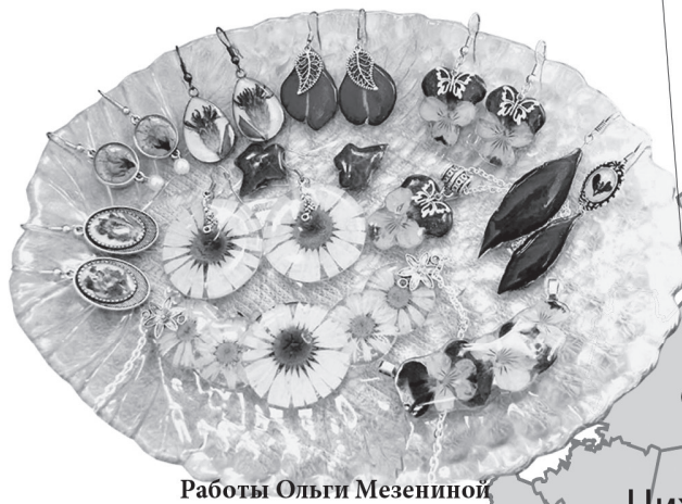
Работы Ольги Мезениной