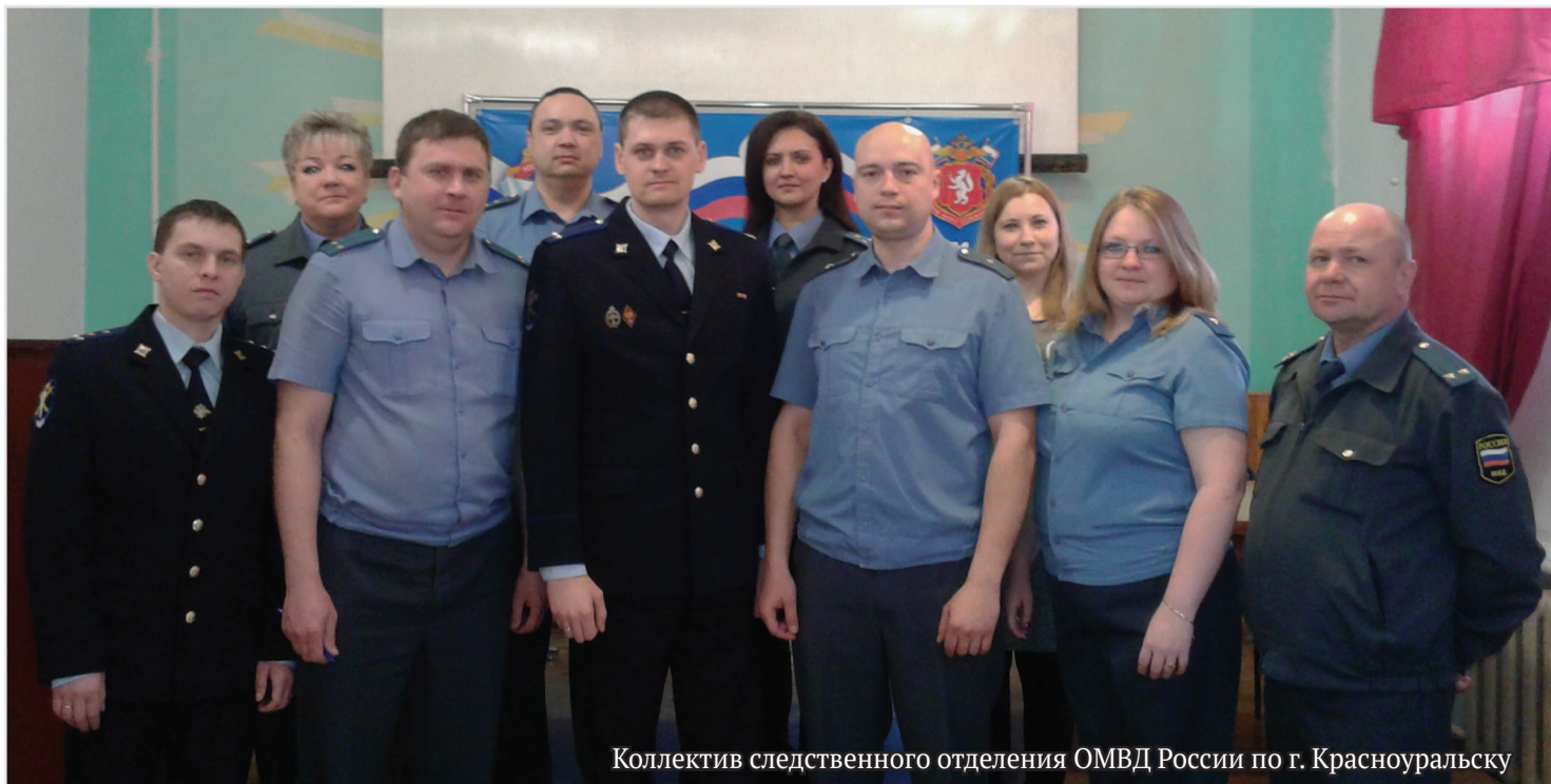
Коллектив следственного отделения ОМВД России по г. Красноуральску