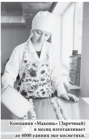
Компания «Макошь» (Заречный) в месяц изготавливает до 4000 единиц эко-косметики.

Получить инвесткредиты смогут также предприниматели из таких приоритетных отраслей, как производство товаров, переработка сельхозпродукции, гостиничный бизнес, инновационные предприятия.