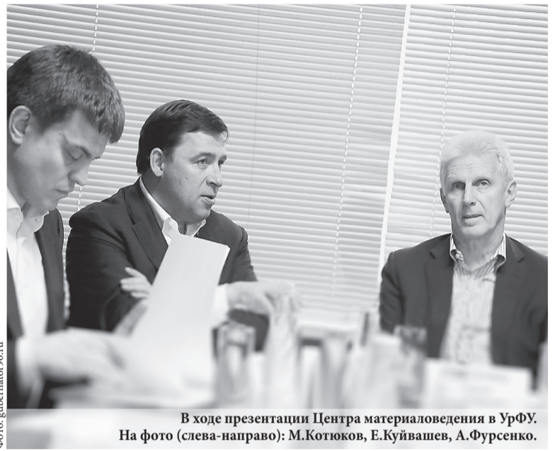
В ходе презентации Центра материаловедения в УрФУ. На фото (слева-направо): М.Котюков, Е.Куйвашев, А.Фурсенко.

По уровню развития образования и науки, с точки зрения технической обеспеченности вузов, Средний Урал может конкурировать с самыми прогрессивными городами и регионами мира. Об этом помощник Президента России Андрей Фурсенко заявил губернатору Евгению Куйвашеву в ходе встречи, которая состоялась по итогам визита в Свердловскую область.