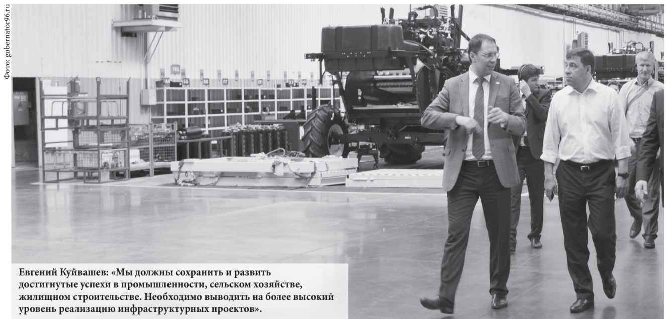
Евгений Куйвашев: «Мы должны сохранить и развить достигнутые успехи в промышленности, сельском хозяйстве, жилищном строительстве. Необходимо выводить на более высокий уровень реализацию инфраструктурных проектов».

Евгений Куйвашев подчеркнул важность того, что с 2016 года для Свердловской области начался новый этап жизнедеятельности – стартовала реализация Стратегии социально-экономического развития региона, рассчитанной до 2030 года. Показатели первых месяцев года свидетельствуют о наличии предпосылок для ее успешной реализации. Индекс промышленного производства в январе-апреле 2016 года составил 109,8%. Индекс производства продукции сельского хозяйства – 103,7%. Индекс физического объема инвестиций в основной капитал в первом квартале 2016 года составил 117,9 процента к соответствующему периоду прошлого года.