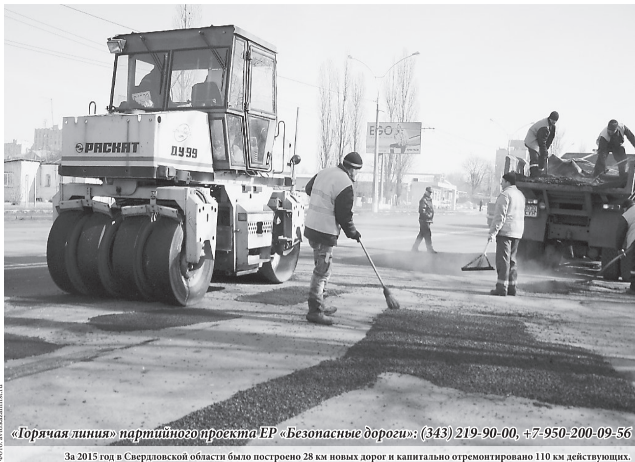
«Горячая линия» партийного проекта ЕР «Безопасные дороги»: (343) 219-90-00, +7-950-200-09-56