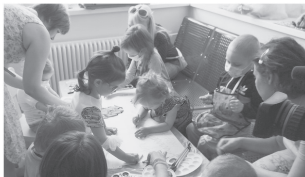
В центре детской онкологии и гематологии ОДКБ №1 в рамках проекта «Искусство против рака» прошло увлекательное занятие, это помогает отвлечь маленьких пациентов от больничных будней.

Первое в Екатеринбурге и восьмое в Свердловской области отделение паллиативной помощи открылось в ЦГБ № 2 имени Александра Миславского.