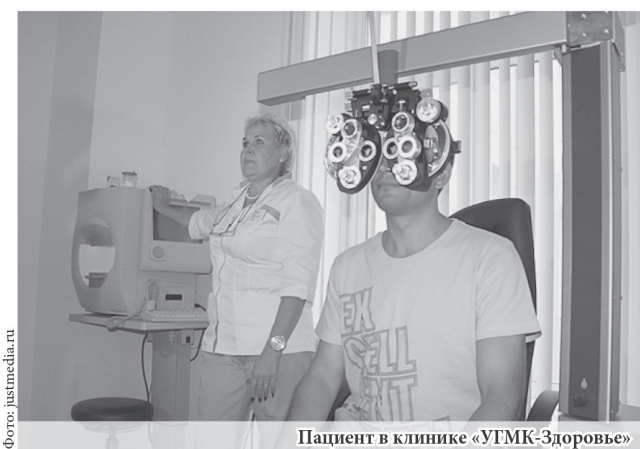
Пациент в клинике «УГМК-Здоровье»

Оренбургские врачи смогли ознакомиться с организацией современной лучевой диагностики, увидели стройку второй очереди медицинского