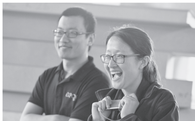
Гости из Китая не скрывают эмоций от увиденного на Иннопроме