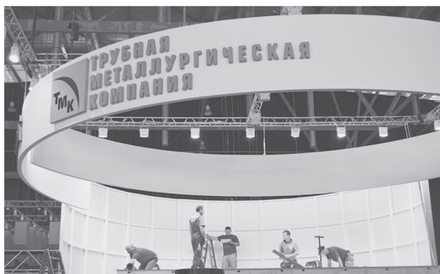
Трубная металлургическая компания в 1-м павильоне на видном месте

В дни проведения выставки организованы специальные автобусные рейсы для посетителей выставки. Городские автобусы будут курсировать в даты выставки 11-14 июля: От станции метро «Ботаническая» до МВЦ «Екатеринбург-ЭКСПО» с 09:00 до 19:30 с интервалом 20 минут. От МВЦ «Екатеринбург-ЭКСПО» до станции метро «Ботаническая» с 09:35 до 20:00 с интервалом 20 минут.