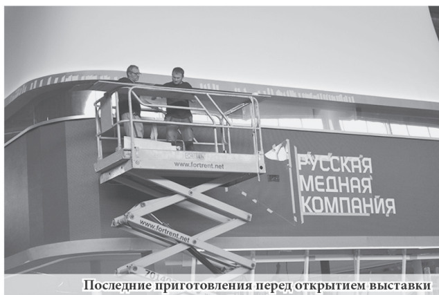
Последние приготовления перед открытием выставки