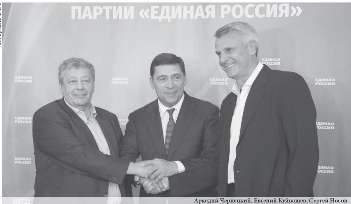
Аркадий Чернецкий, Евгений Куйвашев, Сергей Носов