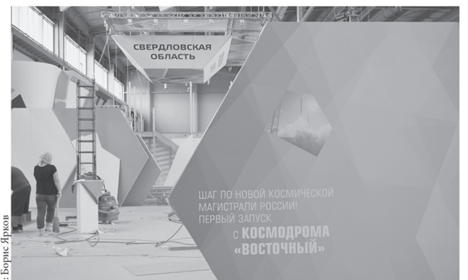
Космодром «Восточный» открыл экспозицию Свердловской области