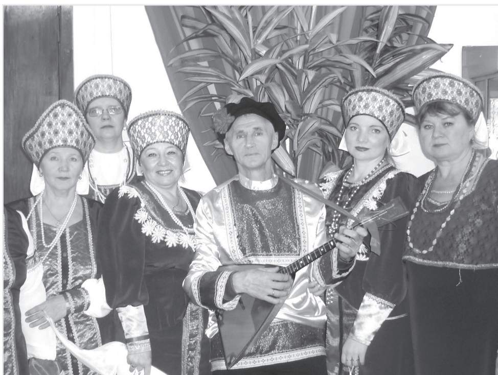
Участники коллектива «Сударушка»

Мне посчастливилось побывать в минувшую субботу на замечательном концерте. Вот уже 25 лет фольклорный ансамбль «Сударушка» радует публику уникальным репертуаром, собирая полные залы.