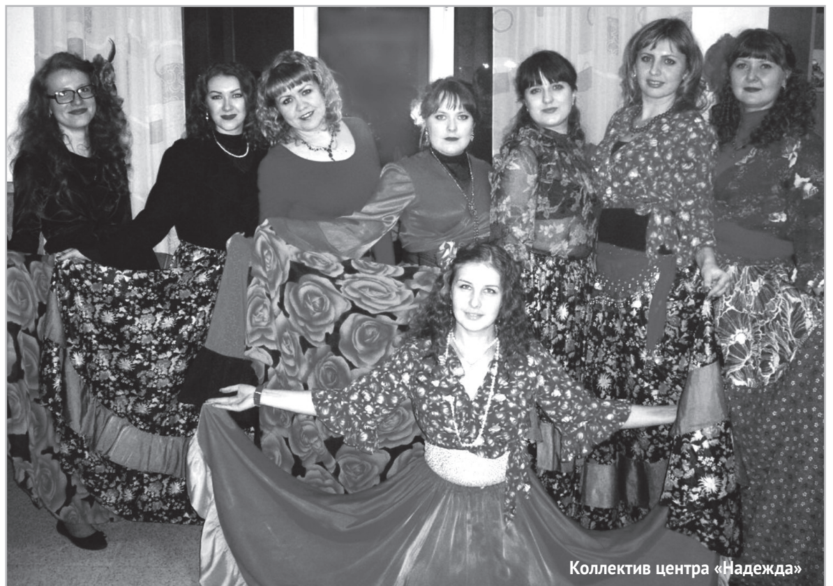
Коллектив центра «Надежда»