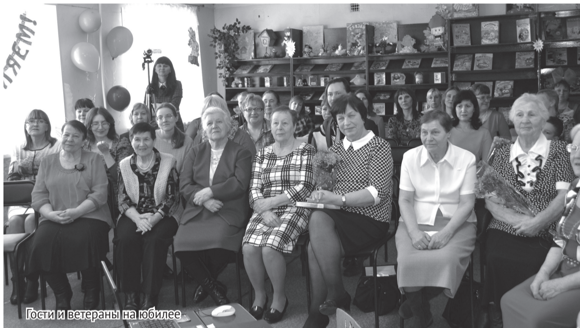
Гости и ветераны на юбилее

Благодаря их профессиональному мастерству библиотека многие годы является подлинным очагом культуры и информации, любимым местом общения для детей всех возрастов. Здесь всегда уютно и комфортно. Можно почитать, поиграть, подготовиться к урокам, встретиться с интересными людьми, поучаствовать в различных конкурсах и найти ответы на многие волнующие вопросы. Посетителей привлекают красиво оформленные выставки и уголки с различной актуальной и нужной читателям информацией.