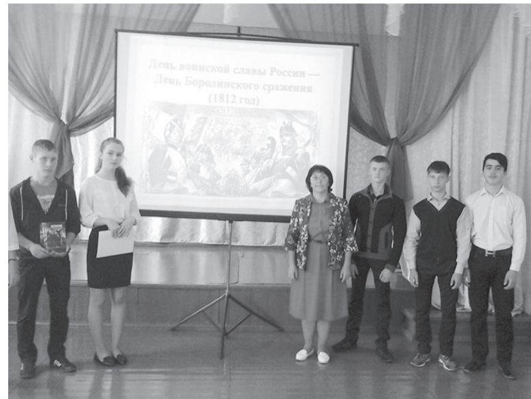
Урок мужества на тему «Бородинской битве – 205 лет» 8 сентября 2017 года