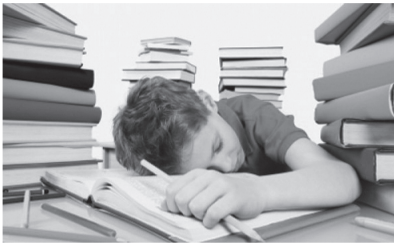
Не спать среди учебников нам поможет пятидневка!

Екатеринбурга (сейчас это очень проблематично на один день), посвящать выходной культурным, спортивным мероприятиям, походам и турпоездкам, благотворительной деятельности и т.д. Чтобы ребенок просто побыл дома с родителями, которых в течение недели почти не видит. Детям нужно просто пообщаться друг с другом, сходить вместе в кино, погулять, сходить в гости... А уж в воскресенье с новыми силами за уроки.