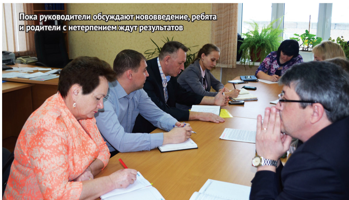
Пока руководители обсуждают нововведение, ребята и родители с нетерпением ждут результатов

На совещании встал вопрос о том, какие виды спорта можно предложить первоклассникам.