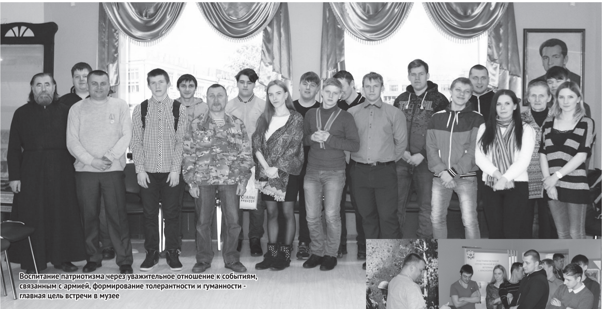
Воспитание патриотизма через уважительное отношение к событиям, связанным с армией, формирование толерантности и гуманности - главная цель встречи в музее

Афганская война ушла в историю, но память о наших воинах, павших в бою, должна быть вечно с нами. Это боль и скорбь.