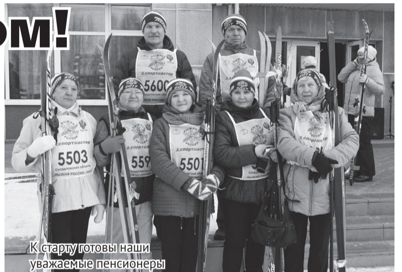
К старту готовы наши уважаемые пенсионеры

Все участники гонки получили на финише вымпелы и значки. Победители и призёры в спортивных группах награждены грамотами МКУ «УФКиС», медалями и шапочками с символикой