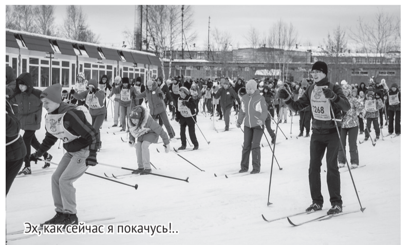
Эх, как сейчас я покачусь!..