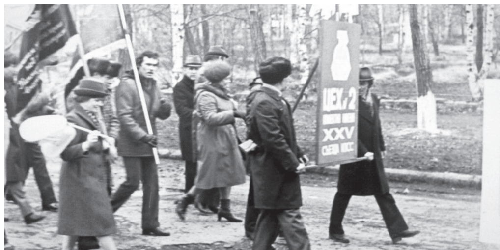
Цех №2 на демонстрации