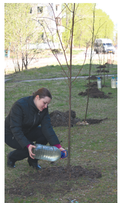
Аллея труда - доброе дело для нашего города