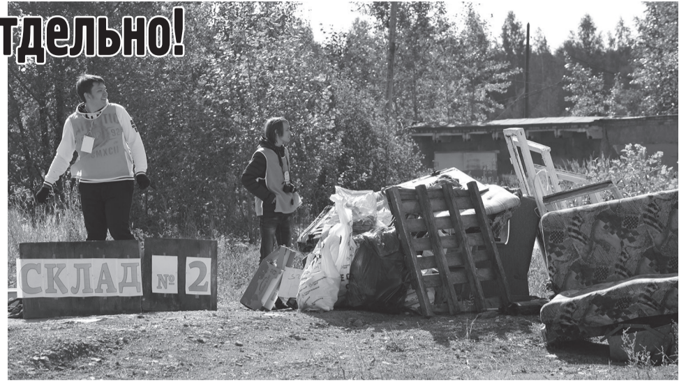
Благодаря ребятам из трудовых отрядов наш город избавился вот от такой горы мусора

Проблема мусора на сегодняшний день уже не просто трудность, а глобальная экологическая задача, которая требует немедленного решения. Не случайно одним из партнеров «Чистых игр» выступает «Фонд развития моногородов», участвующий в проекте «Снижение негативного воздействия на окружающую среду». Одна из целей этой программы - повышение экологической культуры населения путем привлечения к массовым экологическим ак-