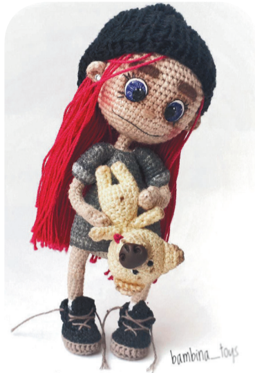
В процессе вязания рождается идея размера и внешних данных героя

- Это все, что у меня есть. Дарю, вяжу на заказ, много ценителей такого вида творчества в интернете.