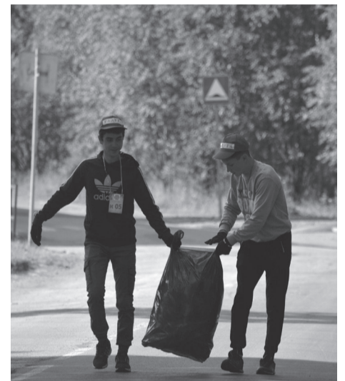
На славу потрудились

Напомним, что в нашем регионе реализуется государственная программа «Обеспечение рационального и безопасного