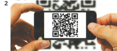
2 QR. Проект предполагает создание сайта с исторической информацией о городе. По всему скверу на вертикальных поверхностях расположены QR коды. При считывании которых гости смогут узнать больше о городе