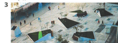
3 Площадки для отдыха