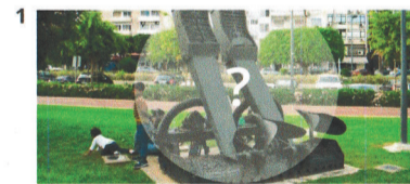
1 Площадь. Основная часть сквера представляет собой транзитную зону. Однако в дальнейшем будет построено общественное здание. В соответствии с этим проектом предусматривается, небольшую площадку с размещением на ней монументом, связанным с индустриальной историей города.