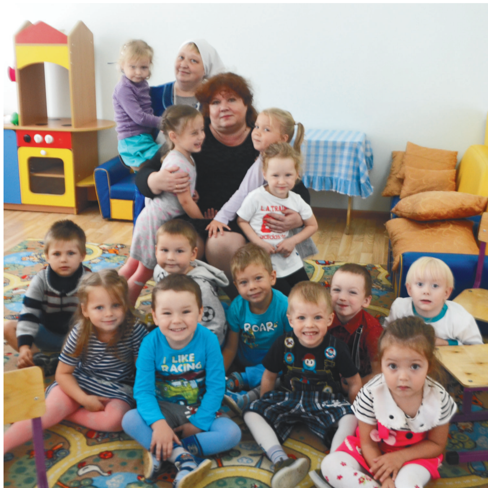
Дети всегда чувствуют любовь и заботу взрослых

вительные! Очень интересно наблюдать, как они растут, развиваются, меняются. Как из несмышленишки превращаются в личность, каждый со своим характером. А еще нравятся их глаза – доверчивые, ждущие, ищущие. Хочется так много сделать, научить их всему-всему!