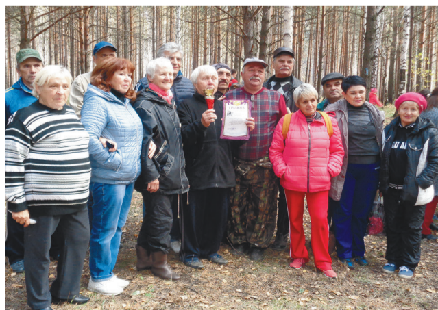
22 сентября на тропе здоровья прошел традиционный 5-й туристический слет под названием «Не