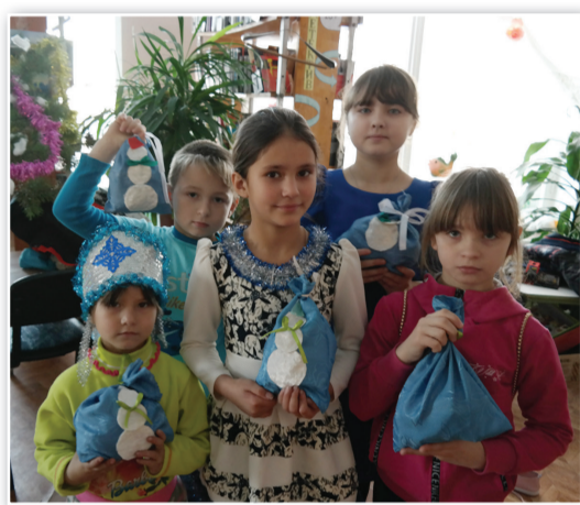
Каждый ребенок получил по мешочку с подарками

Отшумели, отгремели фейерверками и салютами праздники у новогодних елок, которых так долго ждали. Наши активисты решили следовать традициям: привезли из лесу елку, украсили шарами и гирляндами, подготовили сказочное представление и, конечно, пригласили 6 января всех поселковых ребятшек в библиотеку на праздник. С первых минут дети окунулись в сказочный мир.