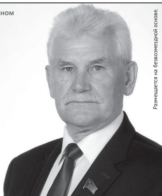
Размещается на безвозмездной основе.