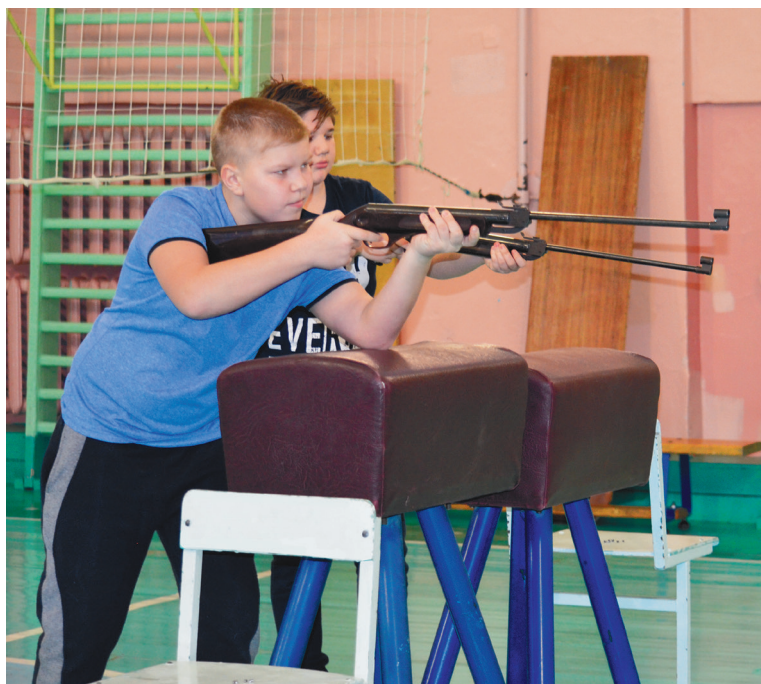
Стрелять по мишеням - увлекательное занятие как для мальчишек, так и для девчонок

Отдельно хочется отметить экскурсионно-образовательные поездки отряда по разным городам Урала. В этом учебном году состоялись экскурсии в Коптелово, Нижнюю Синячиху, Невьянск, Нижнюю Таволгу, Нижнетагильский музей изобразительных ис-