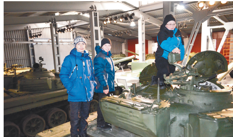
Во время экскурсии по музею военной техники