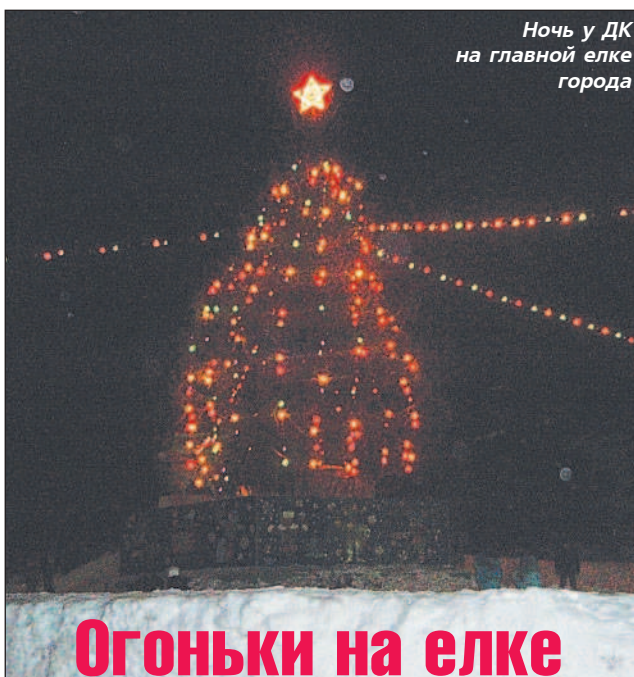
Ночь у ДК на главной елке города