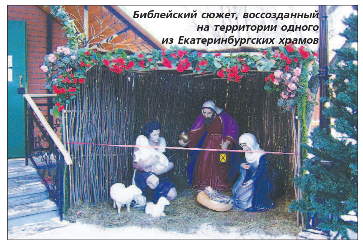
Библейский сюжет, воссозданный на территории одного из Екатеринбургских храмов