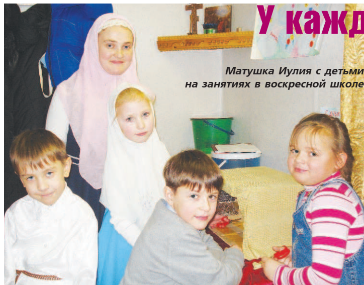
Матушка Иулия с детьми на занятиях в воскресной школе