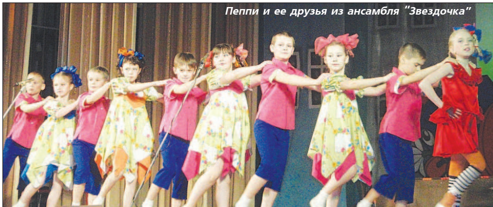
Пеппи и ее друзья из ансамбля "Звездочка"