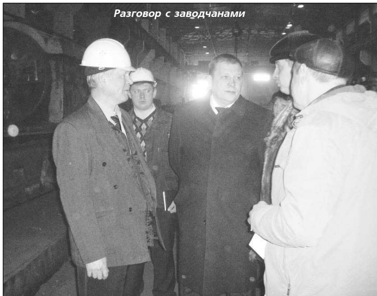
Разговор с заводчанами