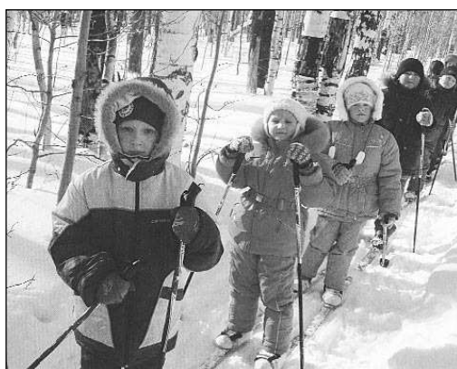
На снимке: подготовишки в одном из лыжных походов.

Но это не беда. Увидеть живого дятла и множество удивительных звериных следов – это ли не чудо! А самые первые шаги по лыжне, как правило, запоминаются на всю жизнь.