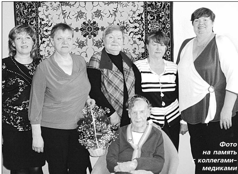
Фото на память с коллегами-медиками

фонендоскоп на случай оказания кому-либо медицинской консультации.