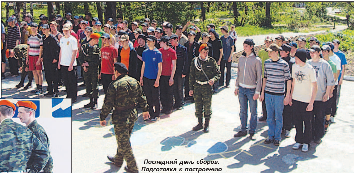
Последний день сборов. Подготовка к построению

Очень приятно, что в школах с октября 2010 года заработала программа военно-патриотического вос-