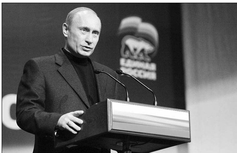
Лидер партии "Единая Россия" Владимир Путин предложил создать Общероссийский народный фронт

Отчетно-выборная конференция Свердловского регионального отделения