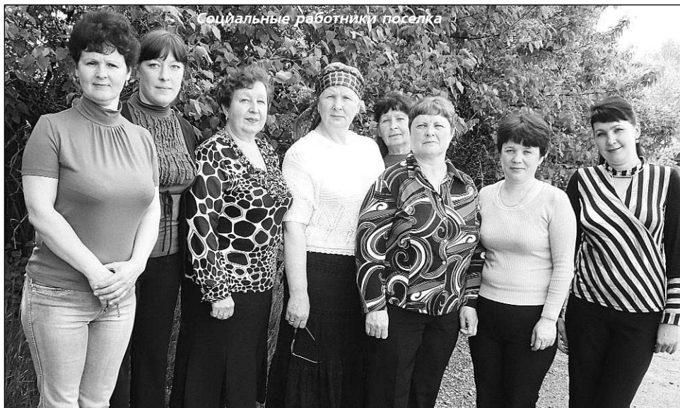
Социальные работники поселка

— В баранчинском отделении 10 участков, социальных работников тоже десять, их возраст от 30 до 60 лет. Со дня