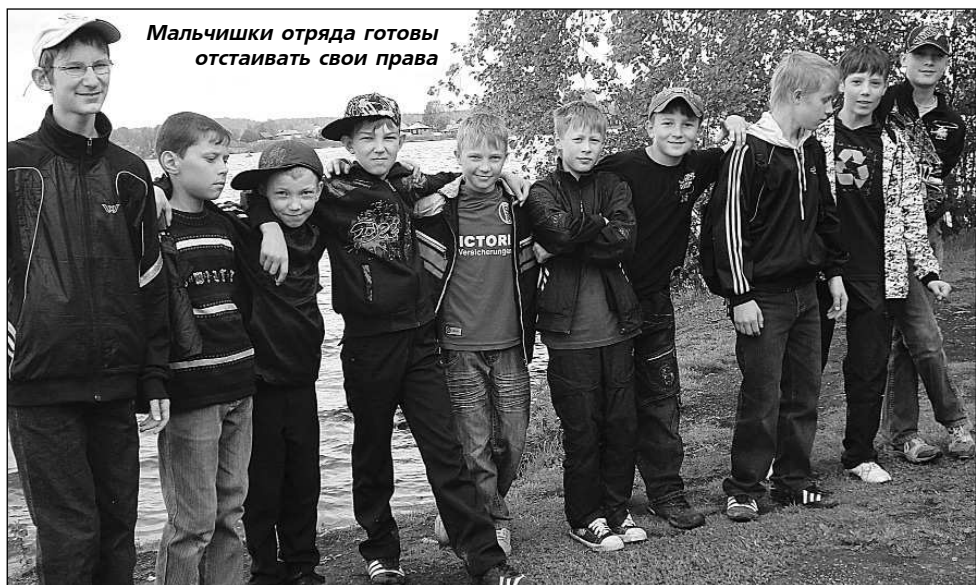
Мальчишки отряда готовы отстаивать свои права