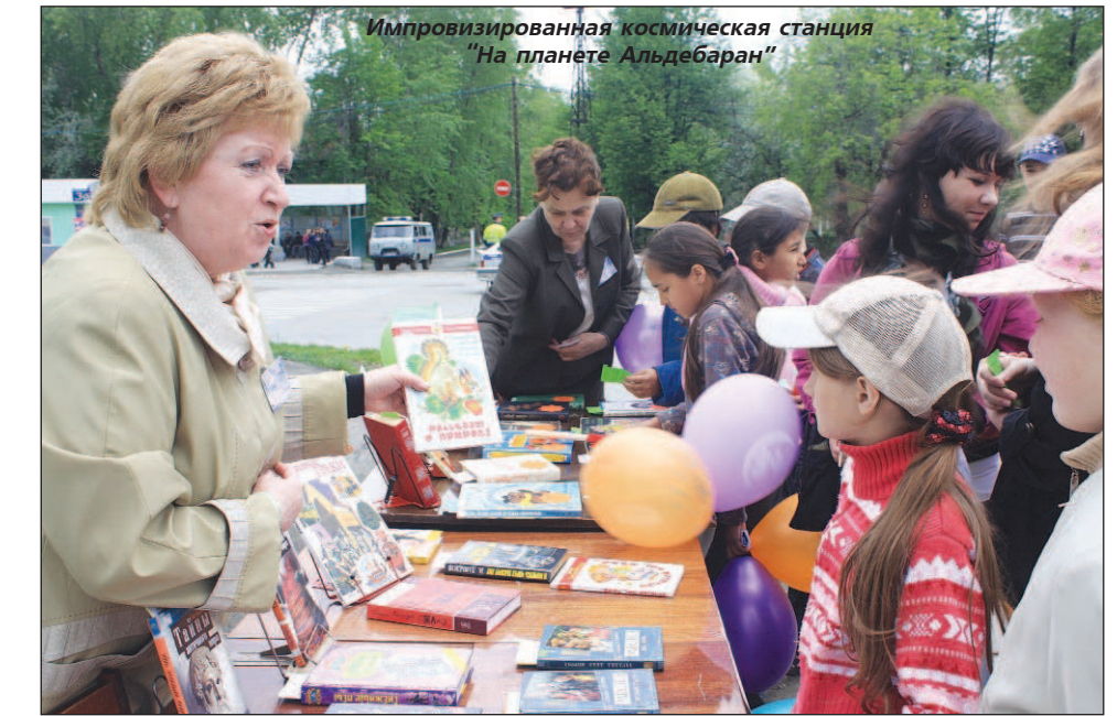
Импровизированная космическая станция "На планете Альдебаран"