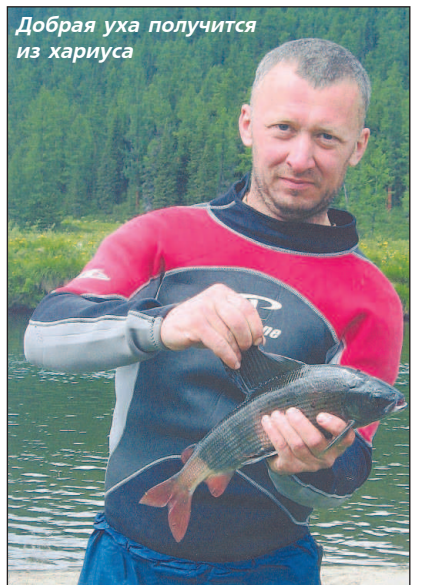
Добрая уха получится из хариуса