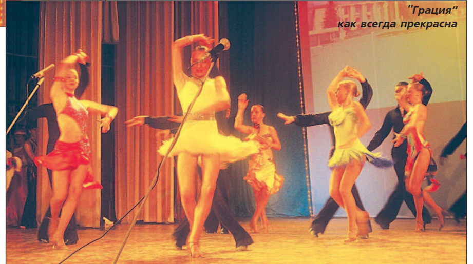
"Грация" как всегда прекрасна