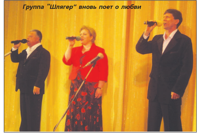
Группа "Шлягер" вновь поет о любви