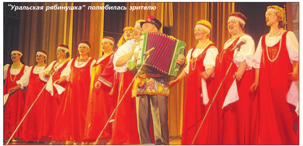
"Уральская рябинушка" полюбила зрителя