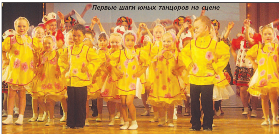
Первые шаги юных танцоров на сцене