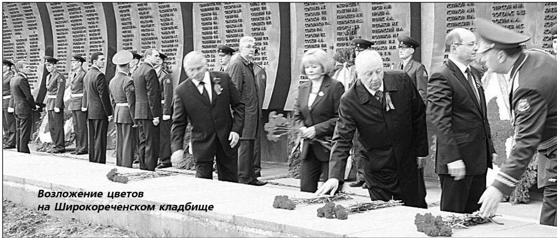
Возложение цветов на Широкореченском кладбище

ДЕПУТАТЫ обеих палат Законодательного Собрания Свердловской области приняли участие в мероприятиях, посвященных Дню Победы.