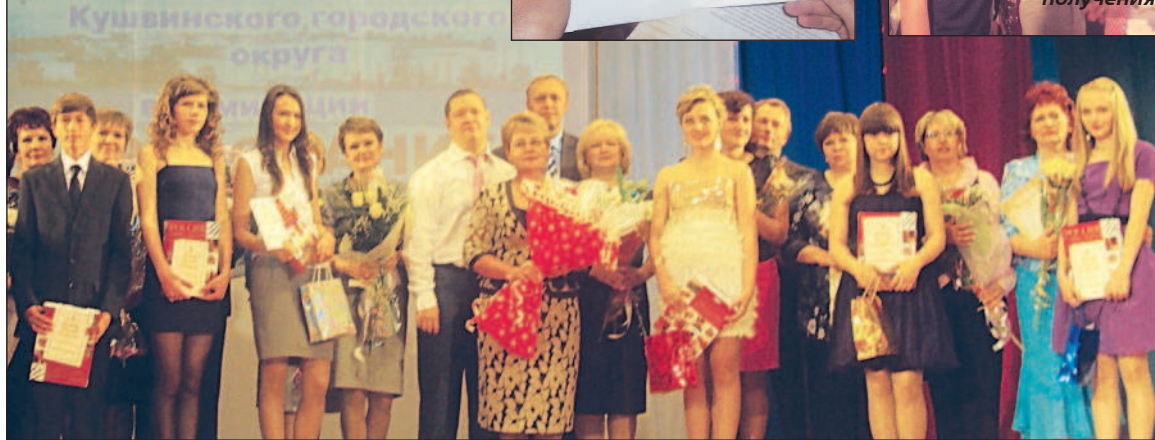
Грантисты школ № 1 и 10

Традиционный городской праздник "Молодежные горизонты", посвященный Дню молодежи и окончанию учебного года, прошел во Дворце культуры в субботу, 18 июня. В 11-й раз город чествовал свою лучшую молодежь за особые успехи в учебе и общественной жизни.