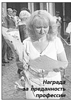
Награда за преданность профессии