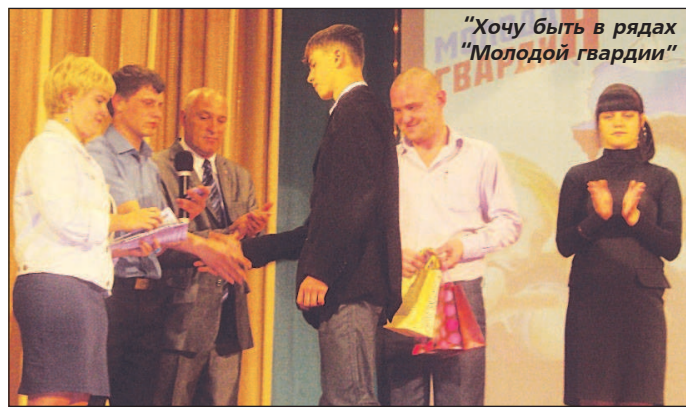
"Хочу быть в рядах 'Молодой гвардии'"