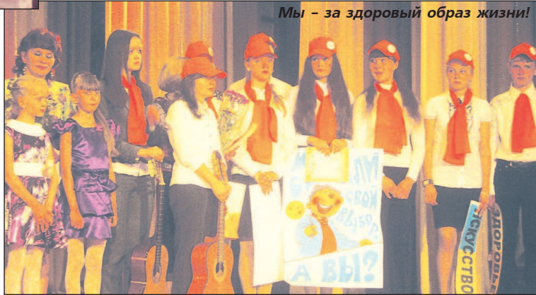
Мы - за здоровый образ жизни!

... РАДОСТНЫЕ лица, море цветов и улыбок, наряженные родители и учителя, взволнованные ученики. Сегодня их день – день оценки и признания заслуг за 9 лет учебы. В этом году впервые на празднике нет выпускников и медалистов – в школах нет ни одного 11-го класса.