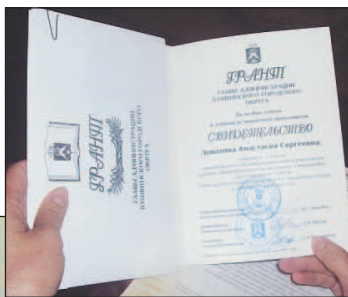
Счастливые моменты получения гранта