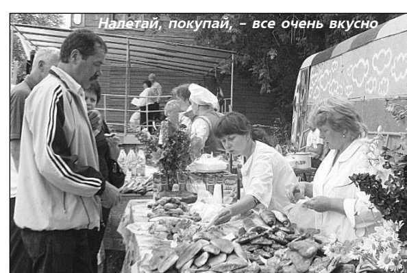
Налетай, покупай, – все очень вкусно