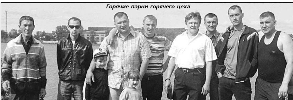
Горячие парни горячего цеха