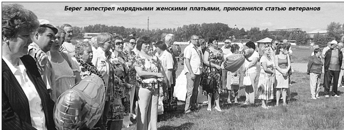
Берег запестрел нарядными женскими платьями, присосанился статью ветеранов