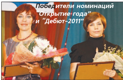
Победители номинаций "Открытие года" и "Дебют-2011"