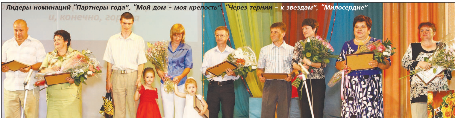
Лидеры номинаций "Партнеры года", "Мой дом - моя крепость", "Через тернии - к звездам", "Милосердие"