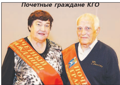
Почетные граждане КГО