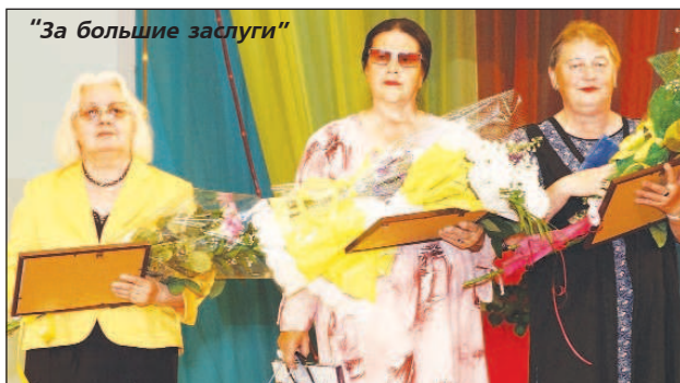
"За большие заслуги"