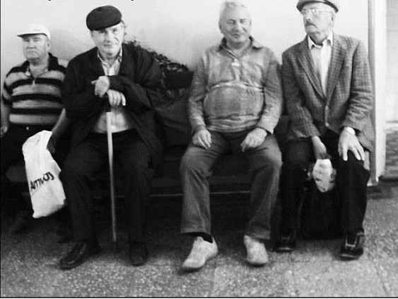
В очереди за парком