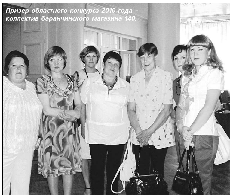
Призер областного конкурса 2010 года – коллектив баранчинского магазина 140.