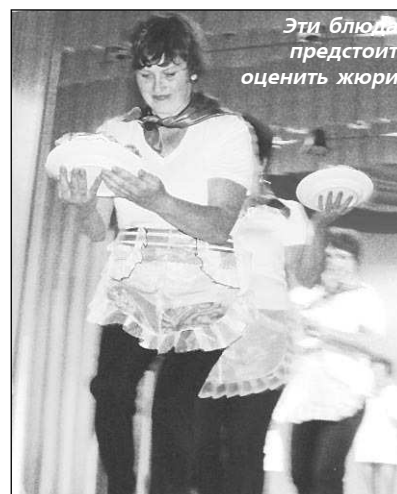
Эти блюда предстоит оценить жюри