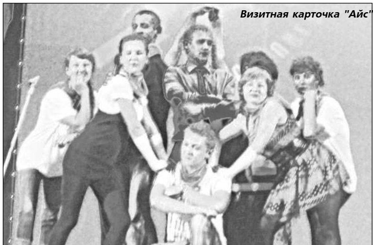
Визитная карточка "Айс"