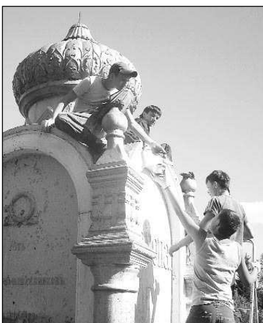
На снимках: юные краеведы на море (вверху); наводят красоту памятнику "Европа-Азия" (внизу).