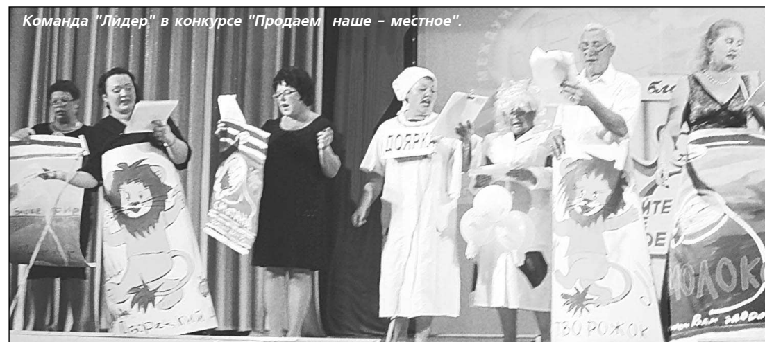
Команда "Лидер" в конкурсе "Продаем наше – местное".