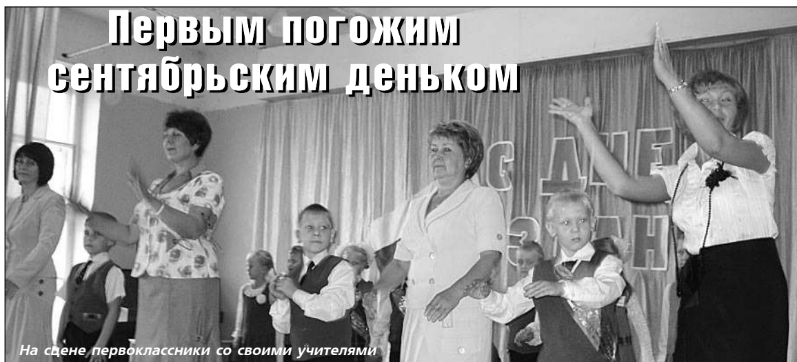
На сцене первоклассники со своими учителями