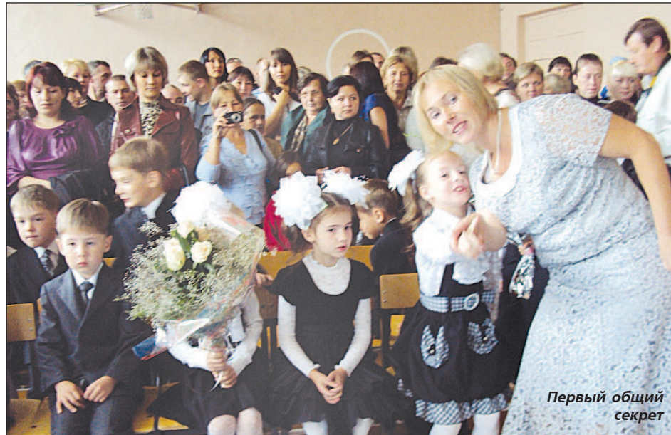
Первый общий секрет