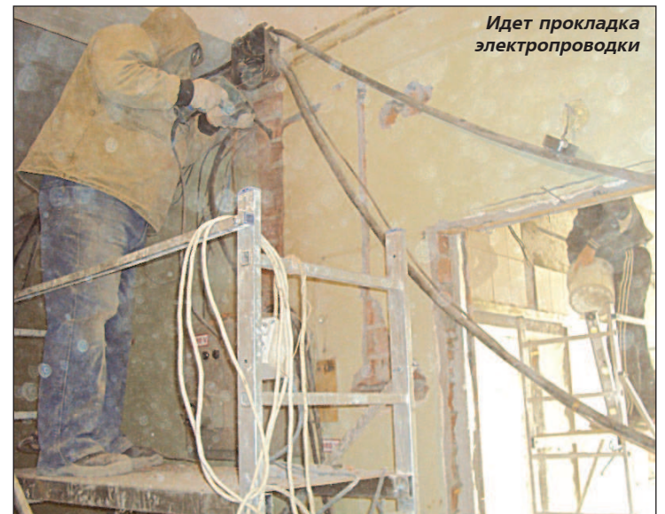
Идет прокладка электропроводки

В КОНЦЕ августа впервые за время, прошедшее со времен Великой Отечественной войны, в Саратове прошли памятные мероприятия, посвященные трагической дате в судьбе российских немцев – 70-летию со дня издания Указа Президиума Верховного Совета СССР "О переселении немцев, проживающих в районах Поволжья". На центральной площади г.Энгельса Саратовской области в торжественной обстановке был открыт памятник жертвам депортации немцев Поволжья.