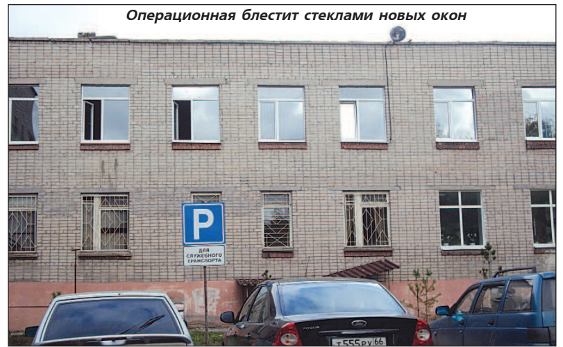
Операционная блестит стеклами новых окон