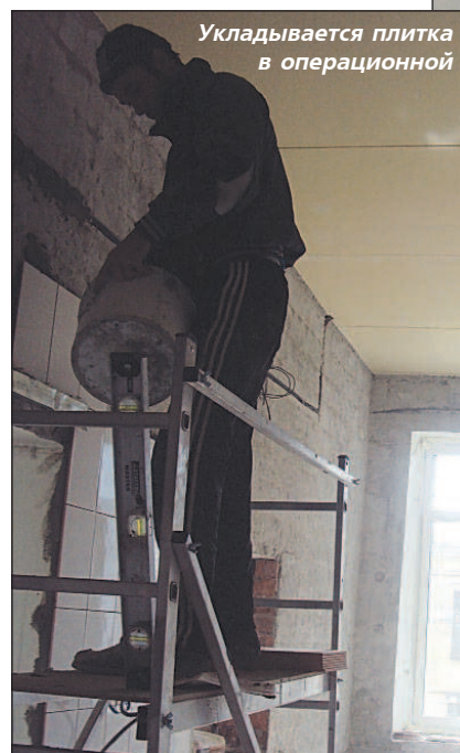
Укладывается плитка в операционной