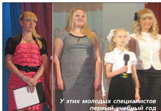
У этих молодых специалистов первый учебный год