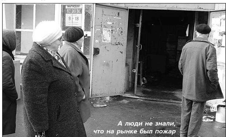
А люди не знали, что на рынке был пожар

В пятницу в семь утра в 77-й ПЧ раздался телефонный звонок. Пассажир поселкового рейсового автобуса сообщил о том, что из помещения продовольственного рынка "Все для вас" валит дым.