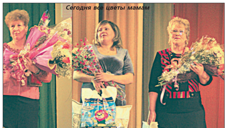
Сегодня все цветы мамам