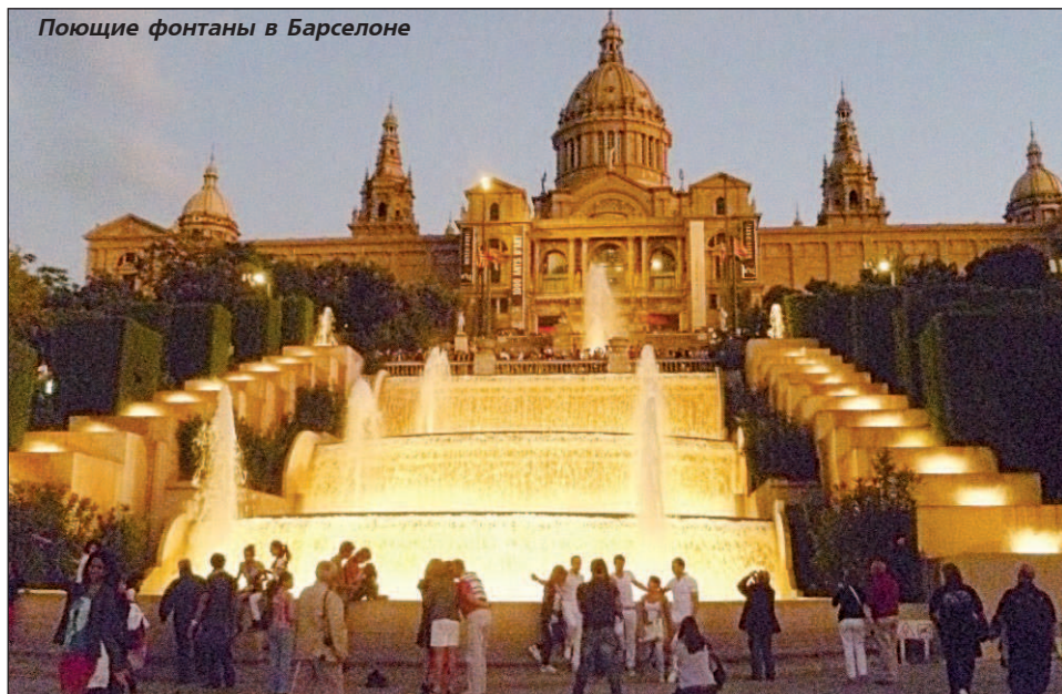
Поющие фонтаны в Барселоне