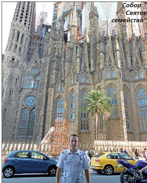
Собор "Святое семейство"

КОГДА в разгаре поздней осени или зимы в толпе прохожих замечаю загорелое лицо, меня невольно накрывает чувство белой зависти: этот человек вернулся с юга! Дома холод, метели, сугробы, а он, словно в раю, нежилась на песчаном пляже и купался в теплом бирюзовом море.