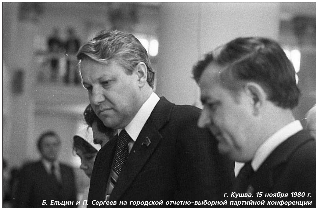
г. Кушва. 15 ноября 1980 г. Б. Ельцин и П. Сергеев на городской отчетно-выборной партийной конференции

Могли ли кушвинцы знать, что он станет первым Президентом новой России?