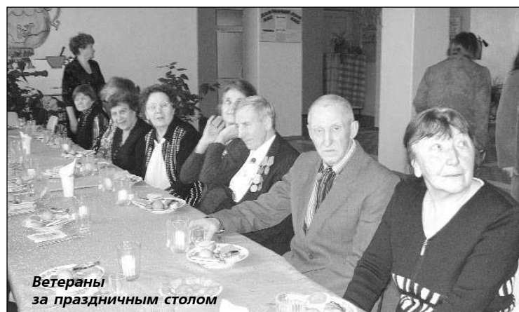
Ветераны за праздничным столом