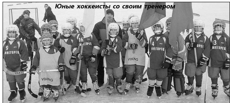
Юные хоккеисты со своим тренером

По окончании матча взрослой команды на ледовом поле появились маленькие хоккеисты с флагами и, сделав круг поче-