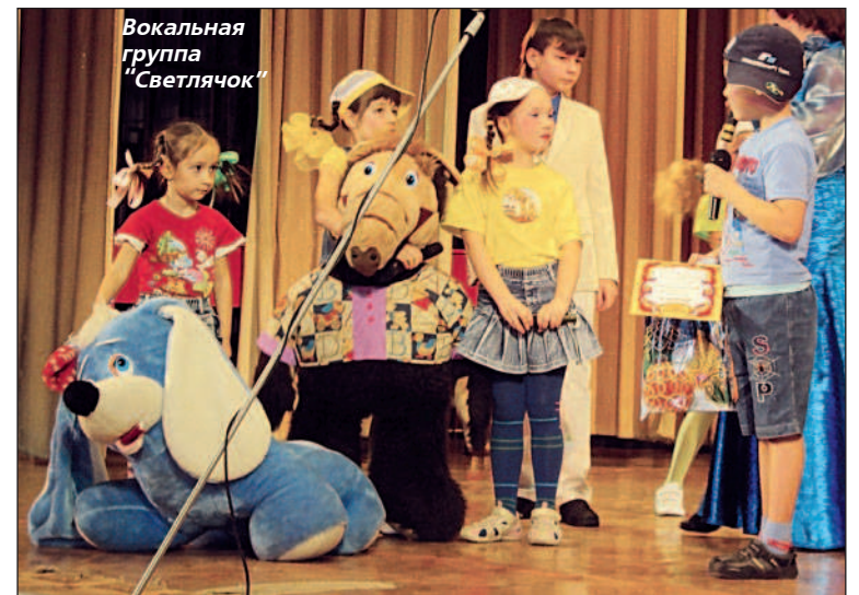
Вокальная группа "Светлячок"