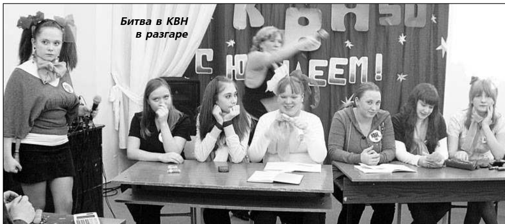
Битва в КВН в разгаре

Смехом и аплодисментами встречал зал каждое выступление. Особенно повеселили ребята из команд "Клёвые повара" и "Девчата". В музыкальном конкур-