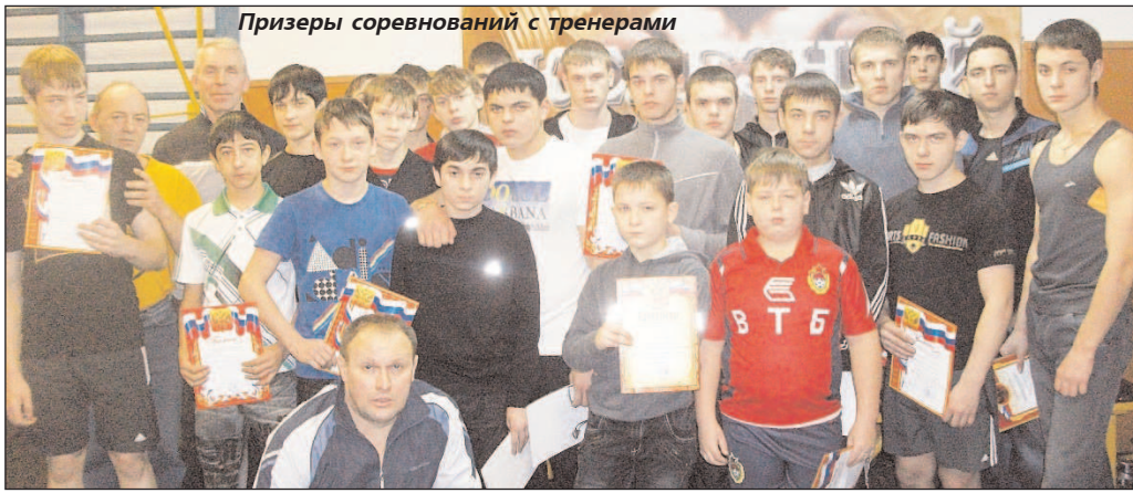
Призеры соревнований с тренерами

11 ДЕКАБРЯ в СК "Горняк" прошло первенство города по жиму штанги среди младших и старших юношей. Лично-командные соревнования проводились по правилам международной федерации AWPC. В них приняли участие 43 человека, поэтому соревнования проходили в 2 потока.