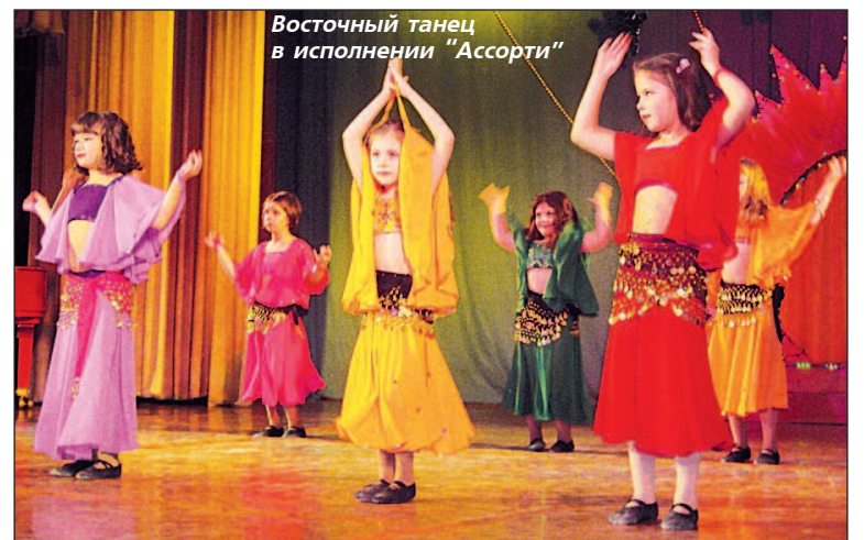
Восточный танец в исполнении "Ассорти"