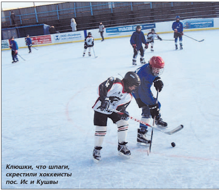
Клюшки, что шпаги, скрестили хоккеисты пос. Ис и Кушвы