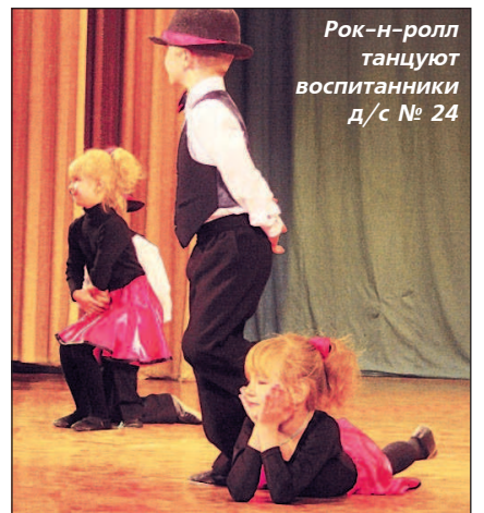
Рок-н-ролл танцуют воспитанники д/с № 24