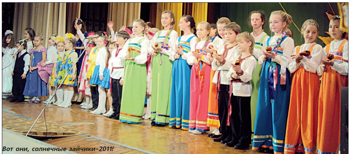
Вот они, солнечные зайчики-2011!