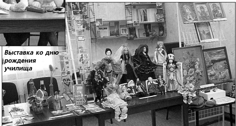
Выставка ко дню рождения училища