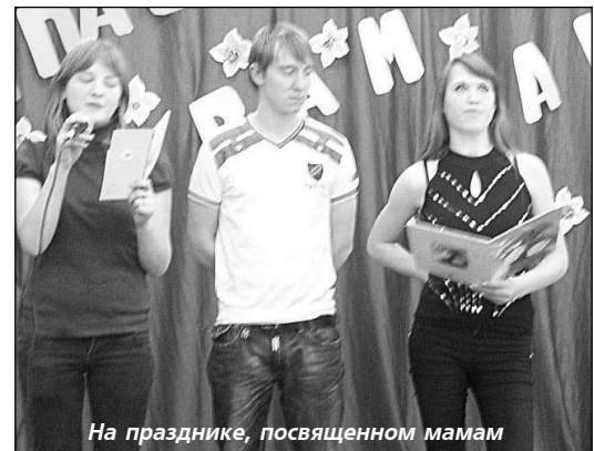
На празднике, посвященном мамам