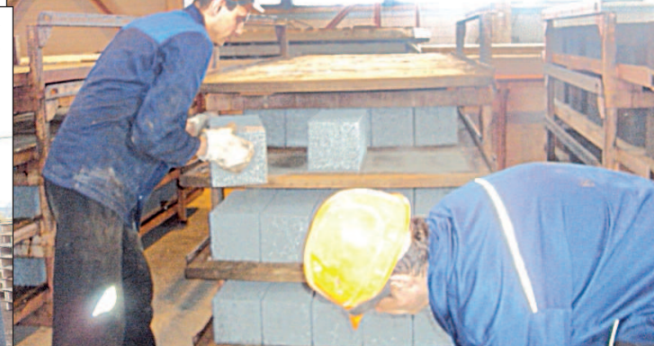
Рабочие выкладывают блоки для просушки

- Я могу сказать вам, что в данный момент у нас есть контракт на поставку блоков в Тюменскую область для строительства девяти трехэтажных домов.