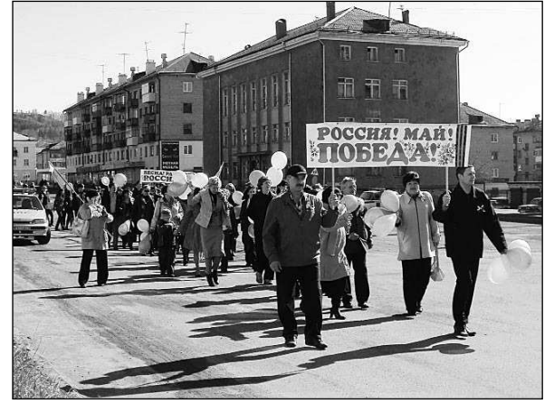
Об изменении движения автобусных маршрутов 1 Мая в Кушве

Программа празднования Первомая - на 4-й, 5-й стр. "РД".