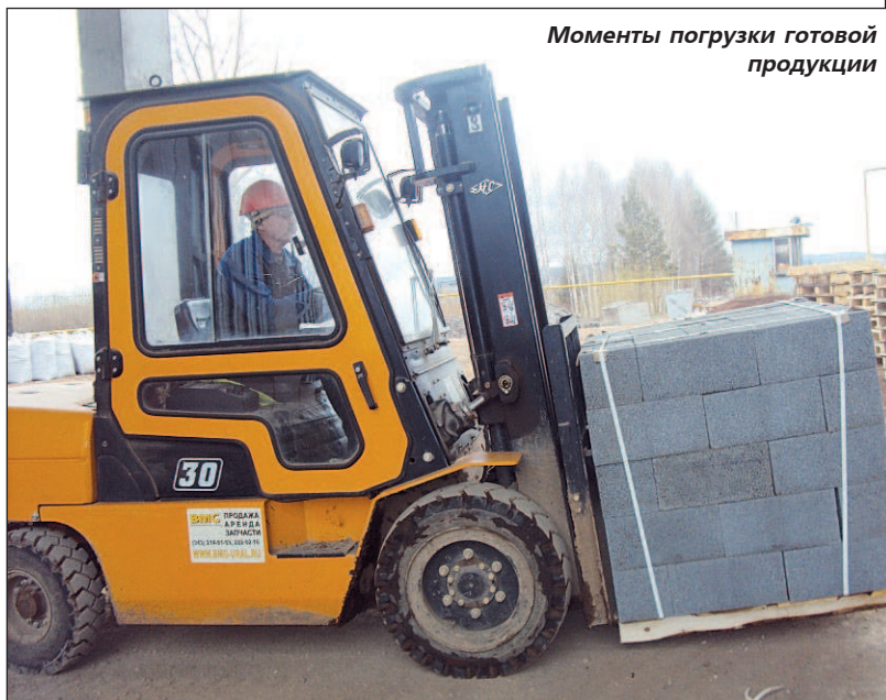
Моменты погрузки готовой продукции

- По результатам 2012 года, средняя заработная плата по заводу выросла на