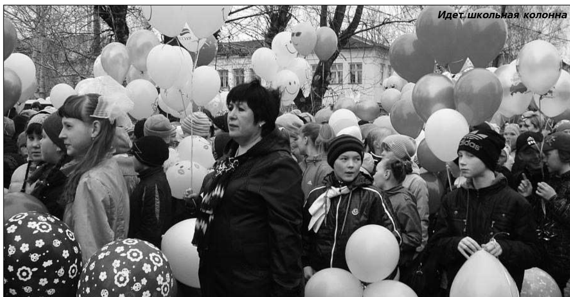
Идет школьная колонна

В ЭТОМ году баранчинцы несколько отступили от давней традиции, и вместо Первомайской демонстрации, провели праздничное шествие по центральной улице Коммуны. Оно завершилось, несмотря на накрапывающий дождь, митингом на площади администрации поселка с концертными номерами.