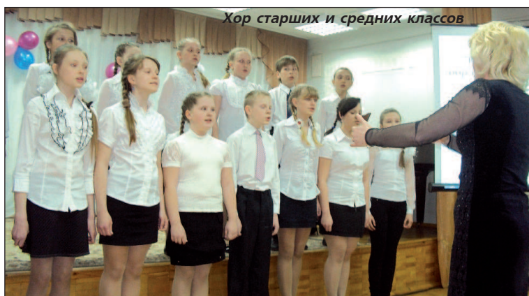
Хор старших и средних классов

"Искусства волшебный свет" - так был назван праздничный концерт и выставка, посвященные 15-летию ДШИ №2. Свет ее окон горит и освещает не только физическое пространство районной станции Гороблагодатская. Он освещает жизнь каждого ребенка, ставшего в один поистине прекрасный день своей жизни ее учеником.