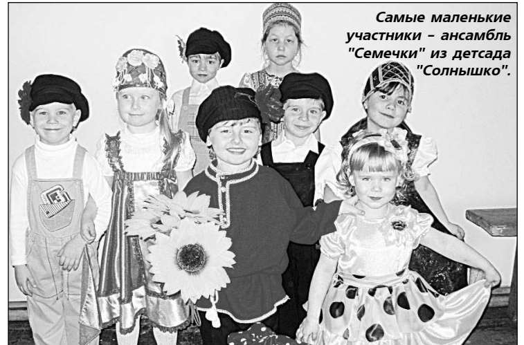
Самые маленькие участники - ансамбль "Семечки" из детского сада "Солнышко".

ЭТОТ фестиваль по праву можно назвать смотром юных дарований. В пятый раз он проходил в ЦКид, собрав 480 участников, начиная с детского возраста и заканчивая молодежью старше 15 лет.