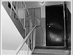
В подъездах жилых домов