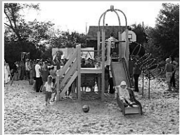
На территории детских площадок, пляжей