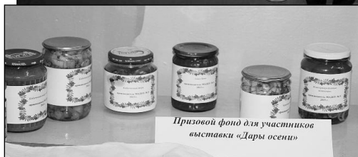
Призовой фонд для участников выставки «Дары осени»