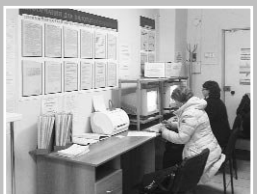
В помещениях соц. служб, в помещениях, занимаемых органами местного самоуправления