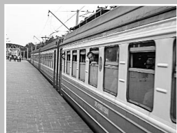
В городском и пригородном транспорте, у входов в здания вокзалов, на платформах пригородных электричек, на воздушных судах