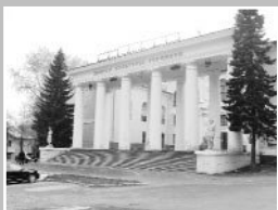
На территории и в помещениях учреждений систем образования, культуры, физкультуры и спорта