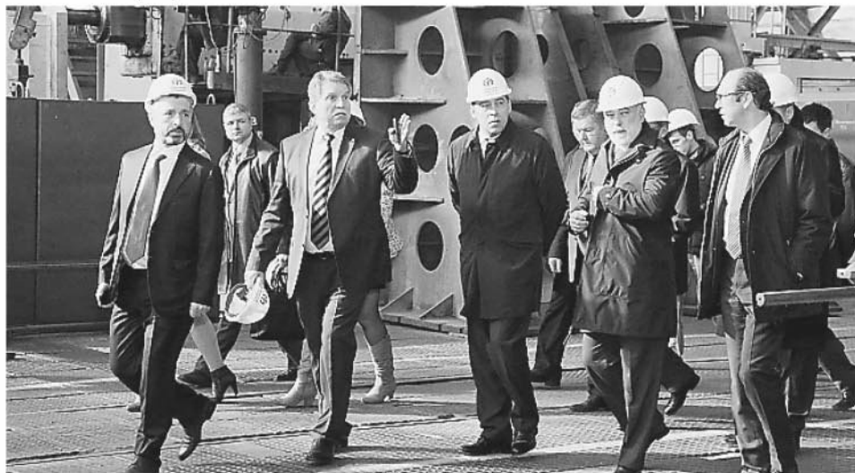
Свердловская область среди регионов России

В 2012-2013 годах Свердловская область сохранила позиции в первой десятке субъектов Российской Федерации по таким важнейшим показателям, как отгрузка промышленной продукции, выполнение гособоронзаказа, оборот оптовой и розничной торговли, платные услуги населению.