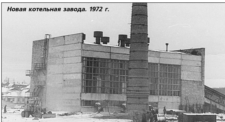
Новая котельная завода. 1972 г.