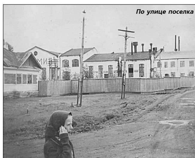
По улице поселка