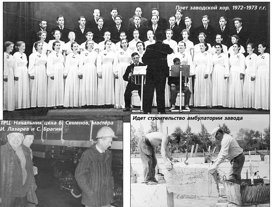
Поет заводской хор. 1972-1973 г.г.