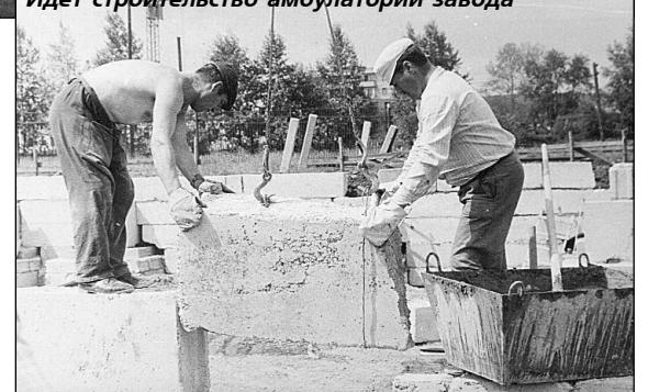
Идет строительство амбулатории завода