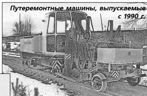
Путеремонтные машины, выпускаемые с 1990 г.