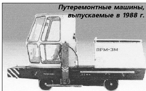
Путеремонтные машины, выпускаемые в 1988 г.