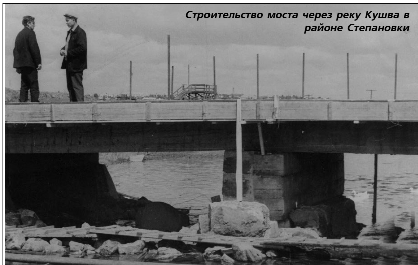
Строительство моста через реку Кушва в районе Степановки