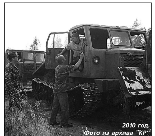
2010 год.