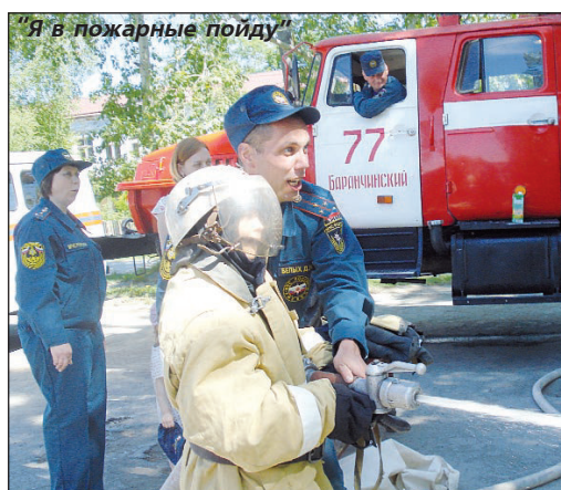
"Я в пожарные пойду"

Требующие большой подвижности разноцветные аттракционы, сладкая вата, поп-корн, шашлык, да и многое другое, вызвали у разновозрастной детворы искреннюю радость. Тут же, на площадке, возле специализированной маши-