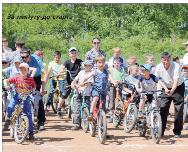
За минуту до старта