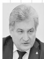
Министр общего и профессионального образования Свердловской области Юрий Биктуганов:

«В этом году впервые чистоту и объективность ЕГЭ обеспечивали