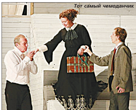
Тот самый чемоданчик

"Чтобы выйти из "леса" нужна смелость..."