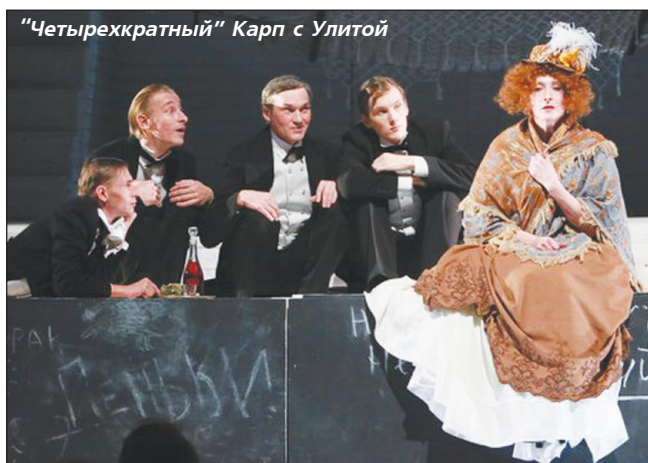
"Четырехкратный" Карп с Улитой