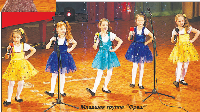
Младшая группа "Фреш"